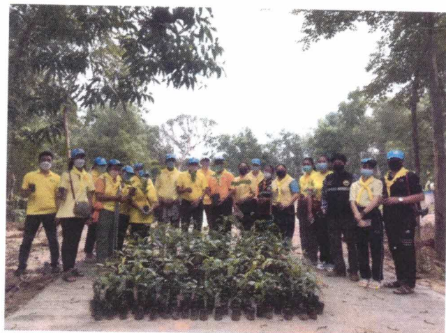
ขับเคลื่อนนโยบาย ตามโครงการถึงขยะเปียกลดโลกร้อน ในพื้นที่ตำบลสงเปลือย