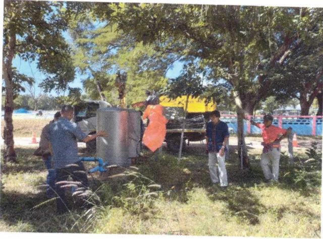
ซ่อมแซมระบบประปา เพื่อแก้ไขปัญหาความเดือดร้อน ของประชาชนในพื้นที่