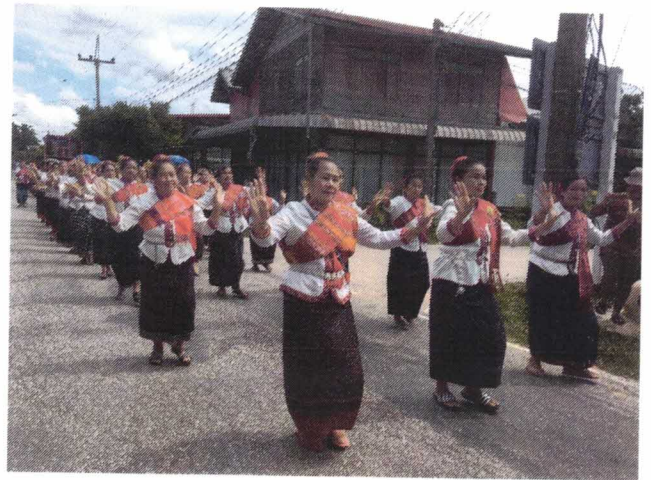
โครงการกิจกรรม วัน อปพร.