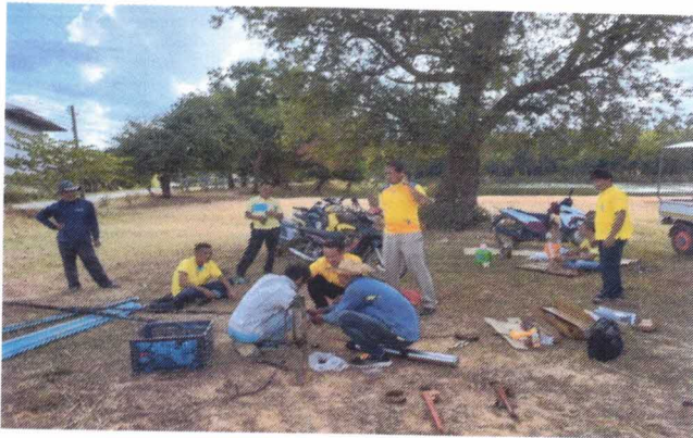
ซ่อมแซมไฟฟ้าส่องสว่าง เพื่อแก้ไขปัญหาความ เดือดร้อนของประชาชนในพื้นที่