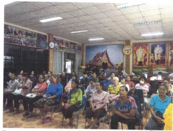
โครงการฝึกอบรมให้ความรู้และส่งเสริมการเลี้ยงปลา ในบ่อพลาสติก