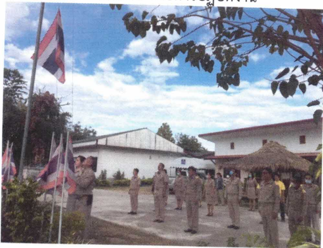
กิจกรรมเข้าแถวเคารพธงชาติ ทุกวันจันทร์ และมอบนโยบายการปฏิบัติงาน