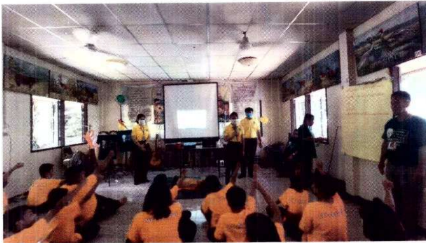
โครงการฝึกอบรมส่งเสริมการประกอบอาชีพครอบครัวตามหลักเศรษฐกิจพอเพียง