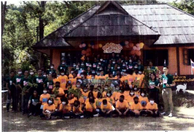
โครงการป้องกันและแก้ไขปัญหามะเร็งสัมพันธ์ก่อนวัยอันควรและการตั้งครรภ์ในวัยรุ่น