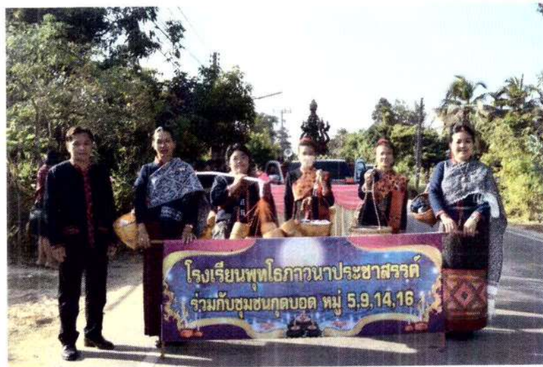
โครงการสืบสานประเพณีบุญบั้งไฟผู้ไทสงเป็ลื้อย